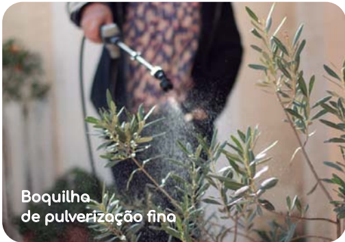
Boquilha de pulverização fina

O depósito translúcido permite controlar o nível do líquido.